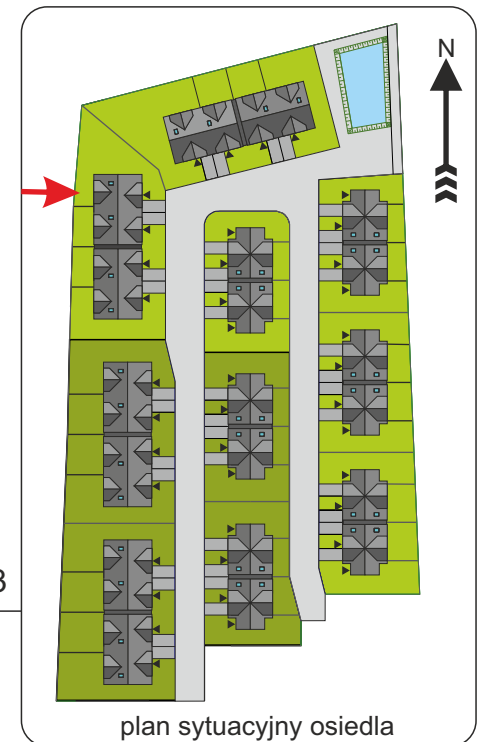
plan sytuacyjny osiedla